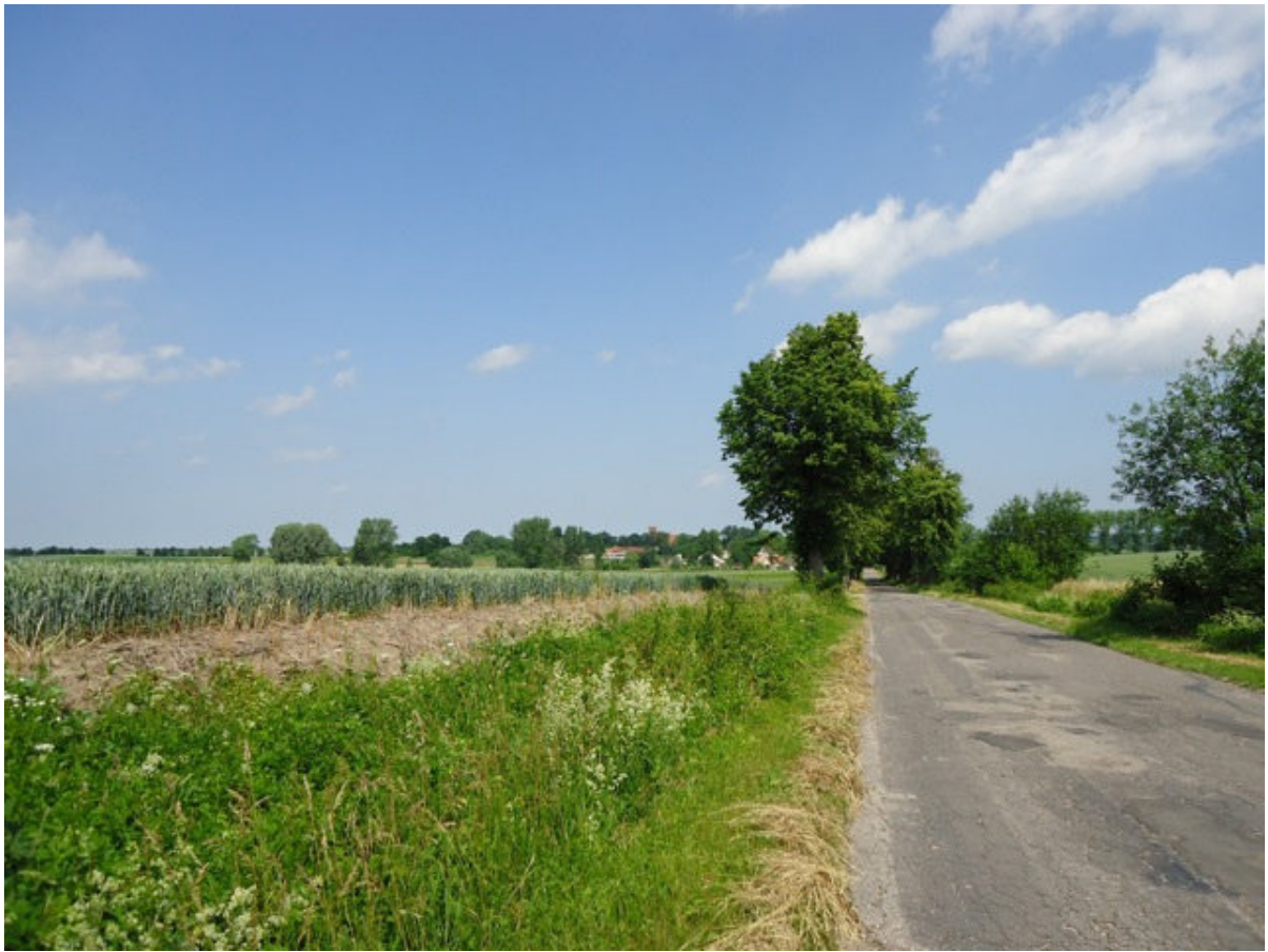
Blick auf Lichtfelde, von Budisch kommend - Sommer 2011