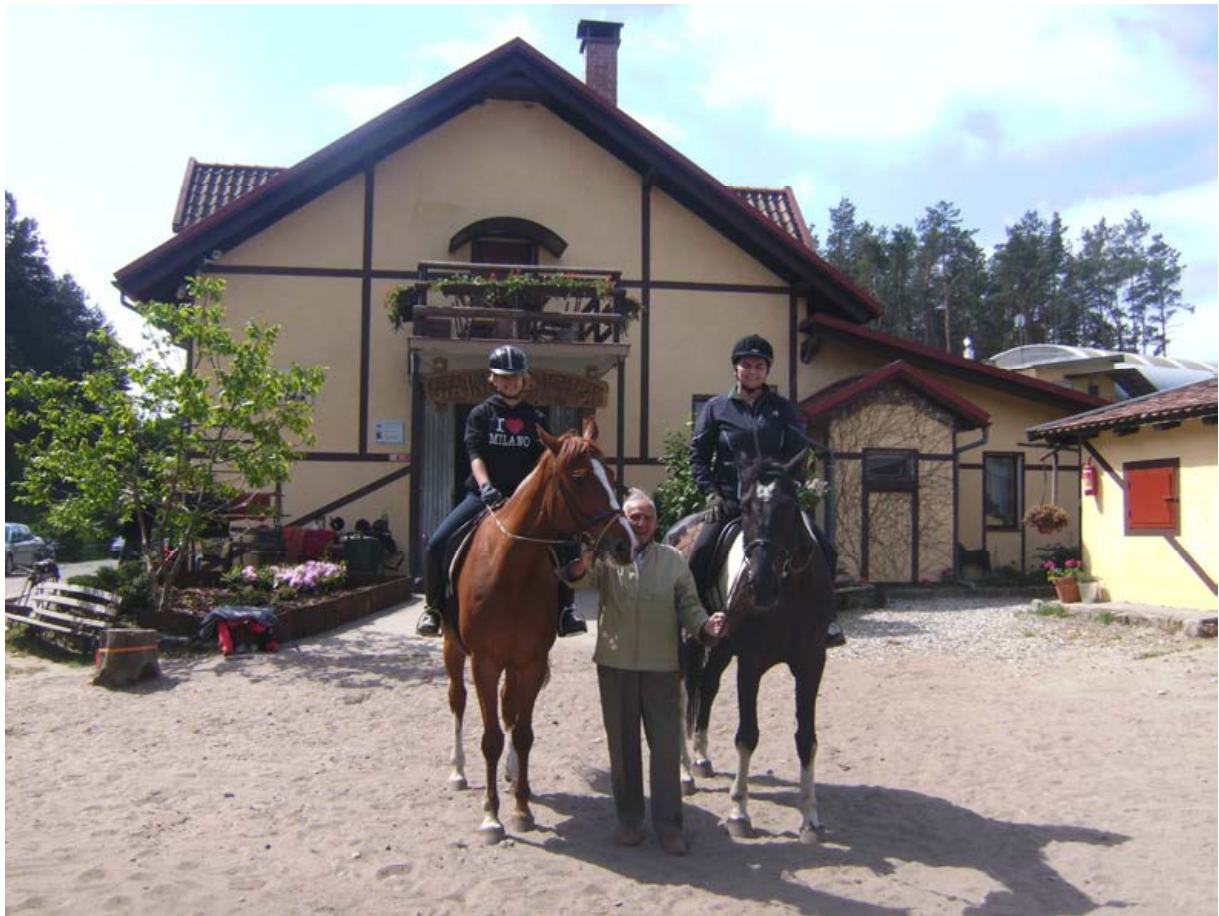
Ich halte die Pferde nach dem Ausritt

am Parlettengraben. Oberhalb der Weiden, wo jetzt Gossas Pferde grasen, stand einst mein Elternhaus. Schule und Jugendheim stehen noch und werden von jungen Leuten mit kleinen Kindern bewohnt. Sie sprechen Englisch und sind offen und freundlich. Sie wissen auch, dass hier mal Deutsche lebten und dass sie ihre Heimat verlassen mussten. Manche glauben allerdings auch, dass die Deutschen einfach nur umgezogen seien. Die Generation ihrer Eltern spricht nur Polnisch und Russisch und hat wesentlich mehr Ressentiments gegenüber deutschen Besuchern. Ja, manche haben sogar Angst und reagieren unfreundlich, wenn man vor ihrem Haus steht und guckt oder gar noch ein Foto machen möchte.