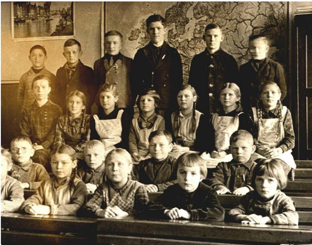
Pr.Damerau (etwa 1938): Eine Schülergruppe im Klassenraum.

Ab 1.2.1937 wurde er in Pr.Damerau fest angestellt. Trotzdem mußte er auch vertretungsweise in Niklaskirchen und Honigfelde (1942) unterrichten. Erstaunt war er, wenn die Schüler in der Pause untereinander polnisch sprachen. Wo das war ist mir aber nicht bekannt. In die Schule in Pr.Damerau gingen auch die Schüler aus Sadlaken.