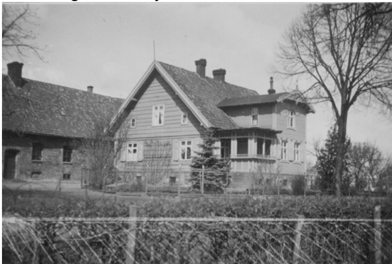
die Käserei Montau, Kreis Schwetz