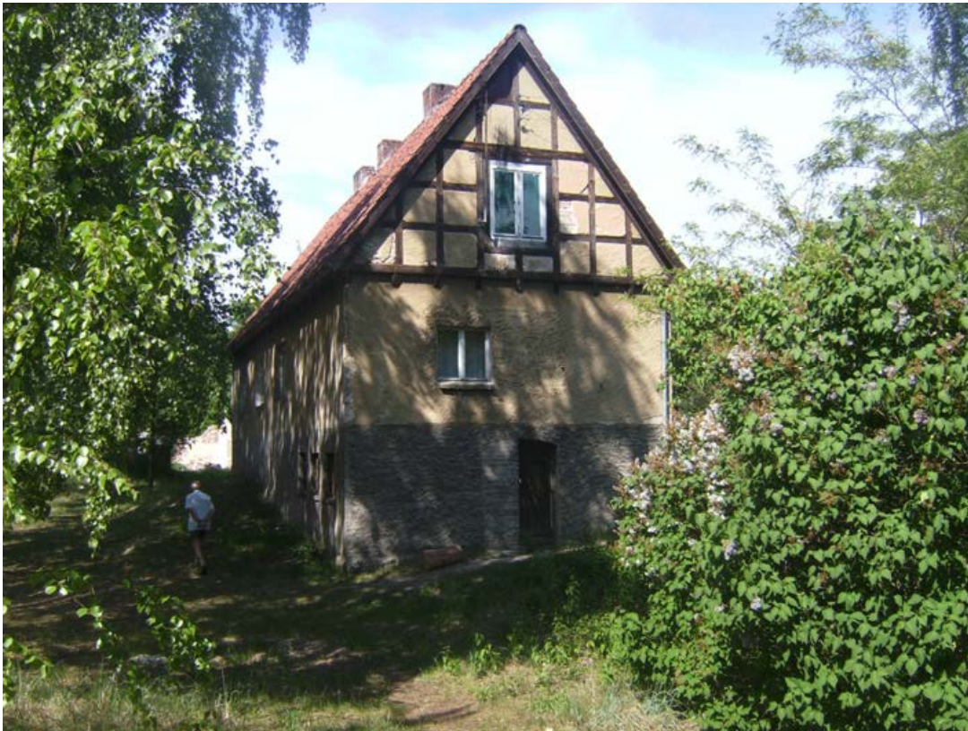
Das alte Jugendheim